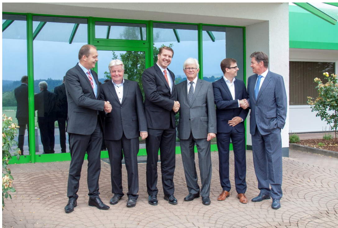
Imagen 1: Disparo de salida de HEGLA-HANIC GmbH como empresa independiente del grupo HEGLA.